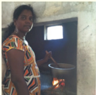
紅茶染めの生地を使用し素敵な製品の制作を行っています。 お楽しみに！

今回は新しく、紅茶染めにもチャレンジしました。井戸から水をくみ、煮出した紅茶で布を染めました。